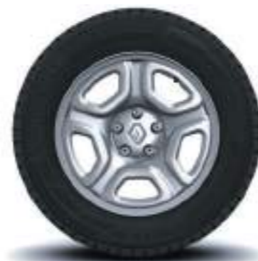
Rines 16" de lámina