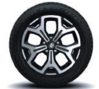
Rin 17" Aluminio - Diamantados