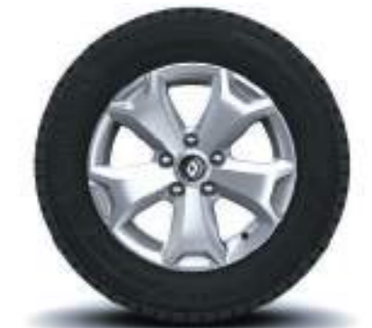
Rin 16" Aluminio